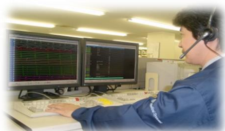
カスタマーサポートセンター