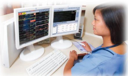
CARESCAPEセントラルステーション